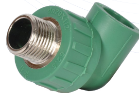
Codo 90° Rosca Macho