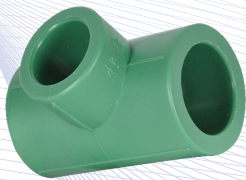
Tee con Reducción