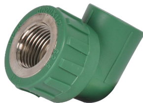
Codo 90° Rosca Hembra